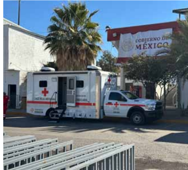
El albergue cuenta con todos los servicios necesarios, administrados por personal militar.

“Sí, ayer llegaron aproximadamente 32 personas antes de esas tres personas en la mañana y son los que activamos ya el refugio, fue la instrucción y dado la situación que ya está instalado al 100% el refugio, ya se están recibiendo ahí los connacionales”, mencionó.