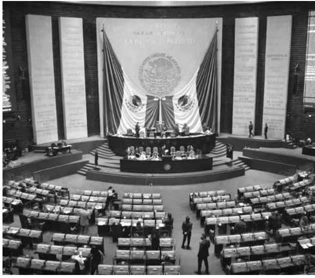
Sesión semipresencial de la Cámara de Diputados.

está demandando que se valla”, puntualizó el legislador sonoreño.