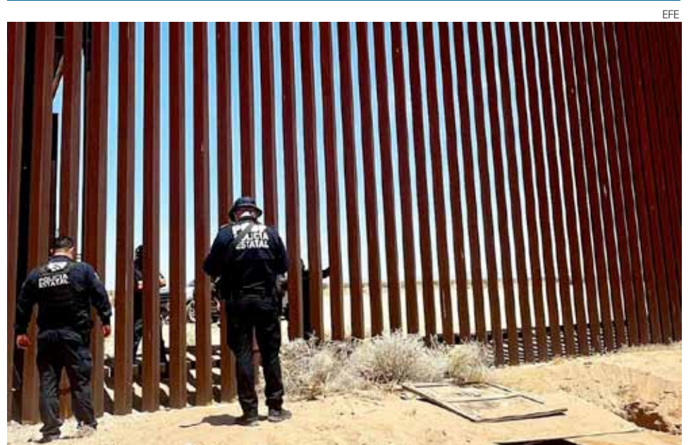
Vista de un narcotúnel construido en el muro fronterizo de acero en el desierto de Sonora.

» Miles de manifestantes se reunieron el miércoles fuera de un tribunal federal en Filadelfia y en los capitolios estatales de Michigan, Texas, Wisconsin e Indiana para protestar contra las primeras acciones del gobierno de Trump. (AP)