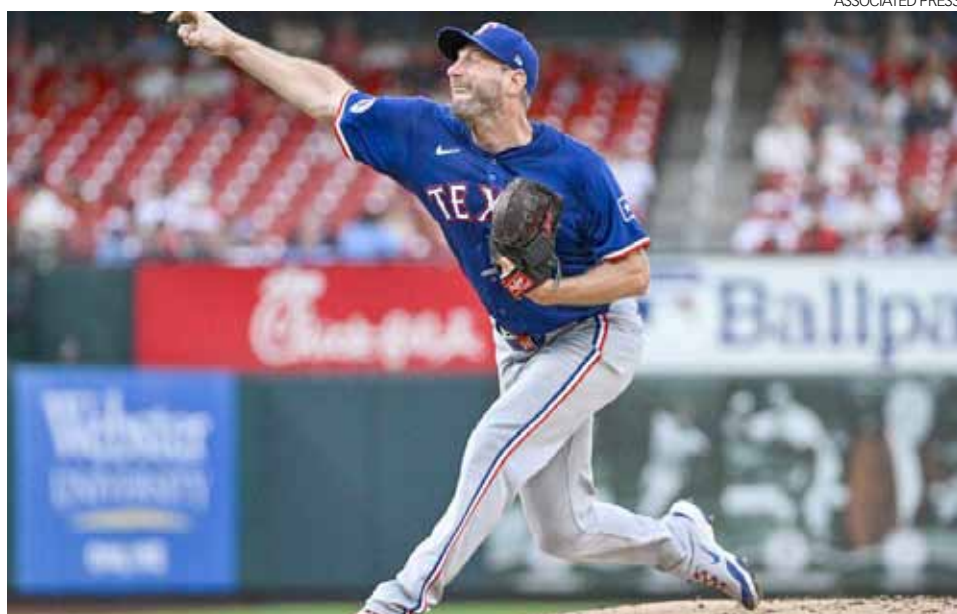
Max Scherzer se vio limitado en 2024 con los Rangers

Permaneció en dicha lista desde el 2 de agosto hasta el 13 de septiembre debido a fatiga en un hombro. No lanzó después del 14 de septiembre debido a una distensión en el isquiotibial izquierdo.