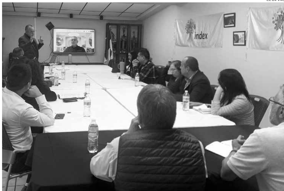
Comité de Comercio Exterior de la Asociación de Maquiladoras de Sonora Index Nogales.

“Recordemos que el gobierno de Estados Unidos hace una exigencia o tres exigencias para terminar en otra y