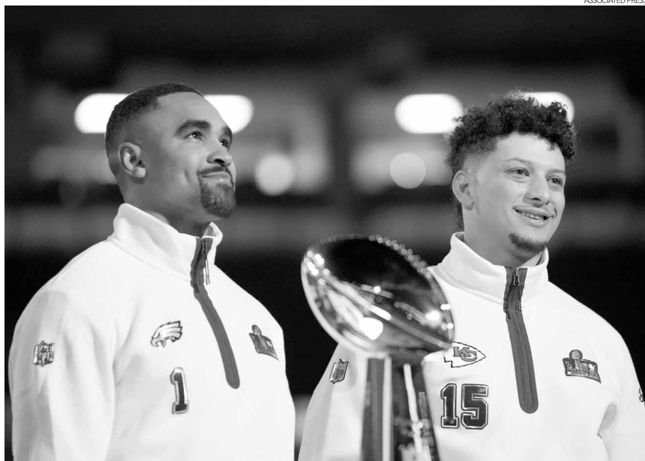
Jalen Hurts, de las Águilas, posa junto al trofeo Lombardi y a su rival del domingo, Patrick Mahomes

NUEVA ORLEANS, LA » Los Jefes ante la oportunidad histórica frente a las Águilas