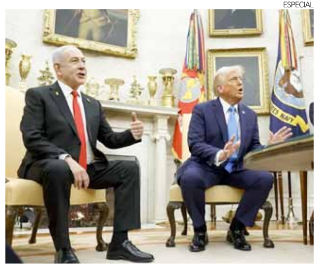
El primer ministro israelí Benjamin Netanyahu (izq.) y el presidente estadounidense Donald J. Trump.