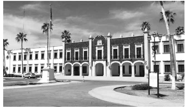
Edificio de Rectoría de la Universidad de Sonora Campus Hermosillo.

Señaló que es indispensable realizar el registro web, donde los aspirantes deberán de subir sus documentos, ya sea kardex hasta el quinto semestre para alumnos que aún se encuentran cursando la preparatoria, o certificado de bachillerato para aspirantes mayores o que hayan rea-