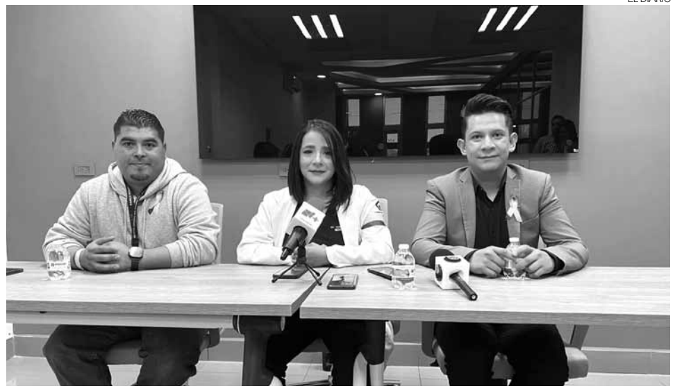
Denuncian desabasto de tratamientos, insumos y equipo médico, falta de personal, y la espera de bases para más de 500 empleados eventuales.

“Es difícil saber exactamente el porcentaje, pero esa es una cifra que esperamos podamos obtener en este 2025 en esa fecha, ya que mucha de la venta de esta temporada se hace en el comercio informal y también hay que considerar que las ventas en línea siguen creciendo”, señaló.