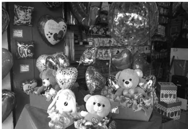
Los comerciantes ya se encuentran preparados para ofrecer mercancía alusiva al 14 de febrero.

En el caso de Sonora, explicó que las exportaciones ascienden a 25 mil millones de dólares anuales, por lo que la aplicación de un arancel tendría un impacto de alrededor de 2 mil 500 millones de dólares.