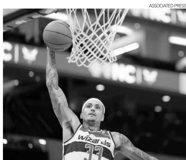
Kyle Kuzma tendrá nuevo equipo el resto de la campaña de la NBA