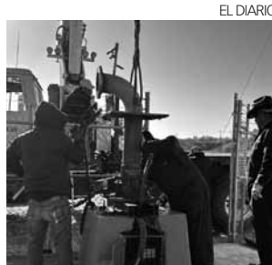
Instan a personal de Oomapas a redoblar esfuerzos para brindar mejores resultados.

En la nueva Cultura del Agua comentó que se tiene mayor rigor en cuanto a las notificaciones y sanciones con usuarios tanto del giro comercial como doméstico en relación al desperdicio de agua potable, para ello es menester, además de concientizar, erradicar este tipo de reportes que a diario se reciben en la línea 073 de Oomapas, en cuanto a desperdicio de agua potable por parte de la comunidad.