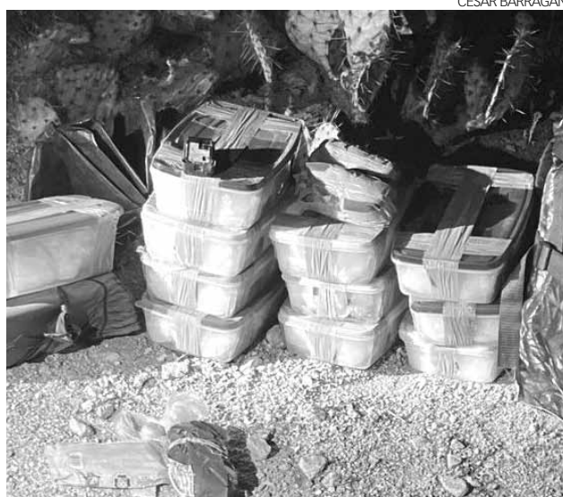
Decomisaron 26.3 kilogramos de metanfetaminas en una zona desértica cerca del poblado de Why, Arizona.