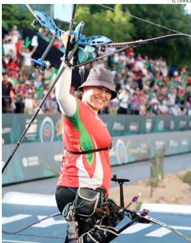
Alejandra Valencia se mantiene rumbo al siguiente ciclo olímpico.