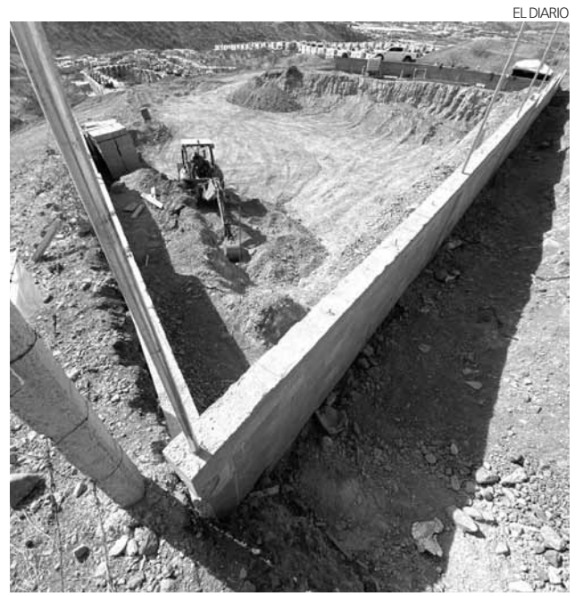
Construcción de un tanque elevado de agua en la colonia San Miguel.

“Por lo pronto nos toca generar trabajo, luchar por esos aranceles, tratar de mantener el Tratado Libre de Comercio con los países que estamos inmersos en él y recordemos que esto es un beneficio del Tratado Libre de Comercio, es un intercambio comercial para que todos tengamos ganancias y trabajo”, concluyó.