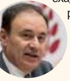
Alfonso Durazo Montaño.

Podría parecer para los comunes mortales, una exageración tanto trabajo en horas-hombre por las amenazas del presidente gringo, sin embargo no deben desestimarse ante un eventual cumplimiento de los amagos.