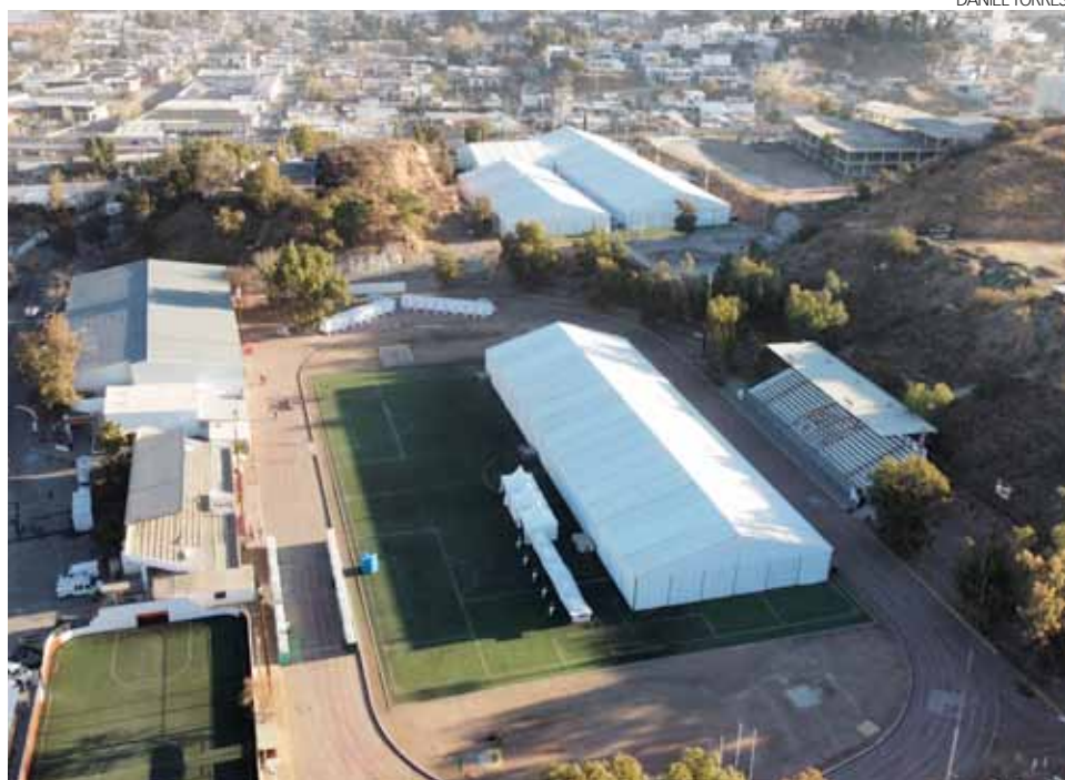
Fotografía aérea del albergue temporal instalado en la unidad deportiva Estrellas Nogalenses.

“La opción es el refugio, primeramente, el que está en la unidad, una vez saturándose eso, se va escogiendo otros refugios para que sea organizado toda la estancia de ellos. Yo pienso que se ha mantenido como ustedes saben, pero pienso que se va a ir aumentando, pero también creo que no va a ser una deportación masiva, cuando menos en el próximo mes en que están haciendo negociaciones y acuerdos a niveles presidenciales”, manifestó el Alcalde. Comentó se espera en