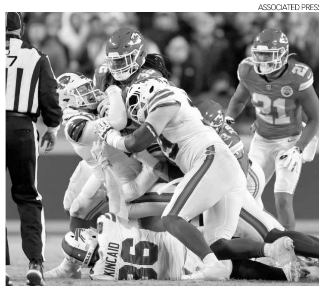
La NFL ha insistido hace tiempo en llevar la campaña a 18 juegos de rol regular