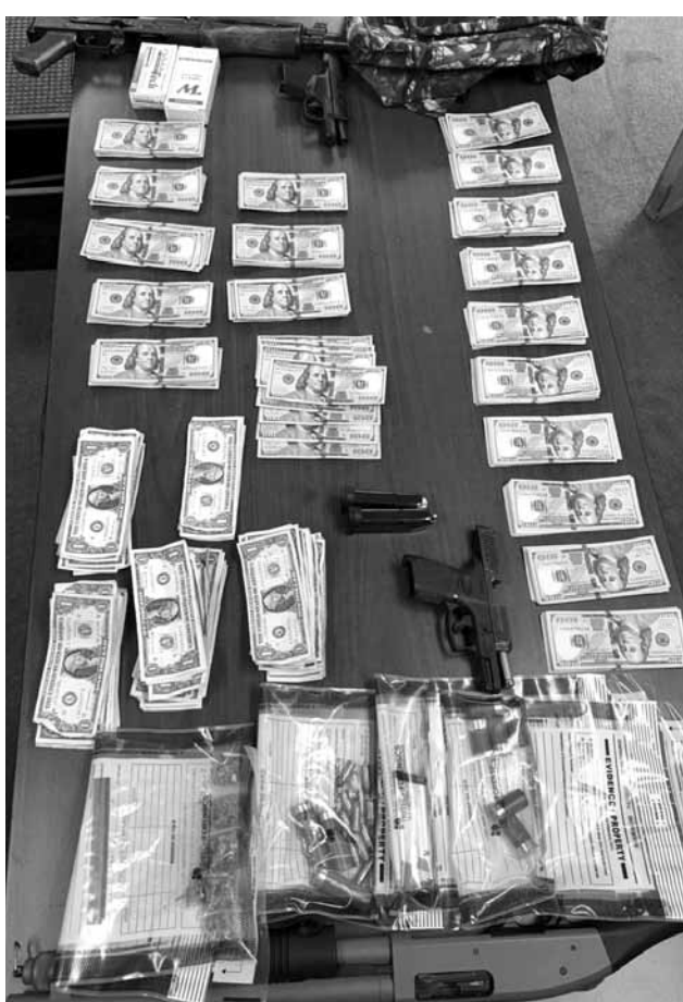
Incautaron armas de fuego, marihuana y dinero en efectivo.

Finalmente, el Vocero del Sector Tucson informó que el pasado 28 de enero, elementos de la Patrulla Fronteriza decomisaron varias mochilas llenas con 26.3 kilogramos o su equivalente a 58 libras de metanfetaminas, en una zona desértica cerca del poblado de Why, Arizona.