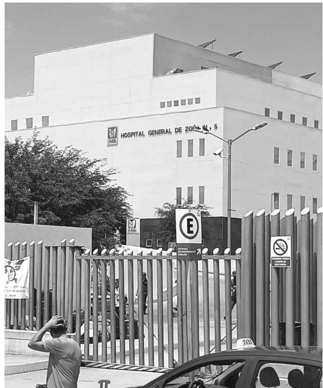
La víctima fue trasladada al Hospital General de Zona No. 5 del IMSS.