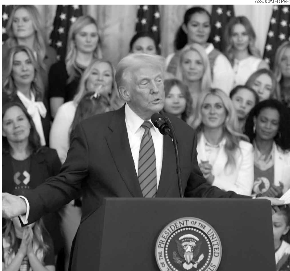
Donald Trump dio un golpe a las aspiraciones de los atletas transgénero.

Trump descubrió durante la campaña que su promesa de “mantener a los hombres fuera de los deportes femeninos” resonaba más allá de los límites partidistas habituales.