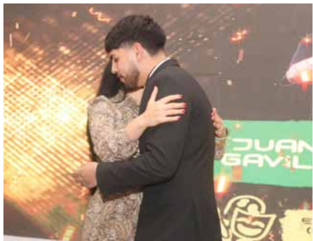
de Expresiones Artísticas y Discapacidad e Integración, respectivamente. Sus proyectos, presentados bajo la asesoría del Instituto