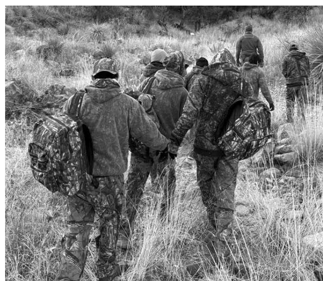
Lograron el arresto de un ciudadano estadounidense y de seis personas más, todos ilegales en EU.